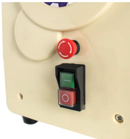
Рис 5 Панель управления. Электромагнитная комплексная кнопка Пуст/Стоп, Аварийный стоп.